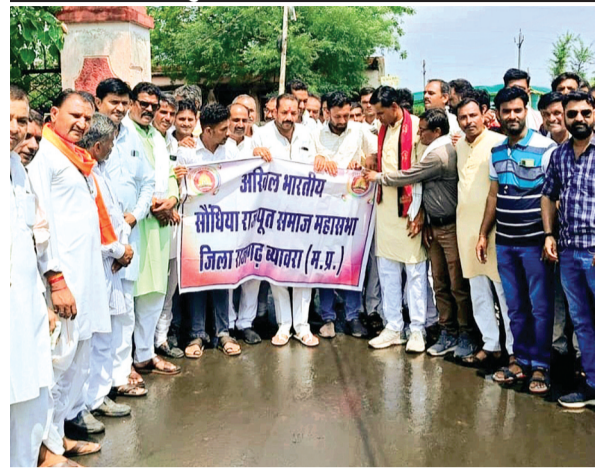
हरिभूमि न्यूज | राजगढ़

कलेक्टोरेट पहुंचकर सीएम के नाम सौंपा ज्ञापन