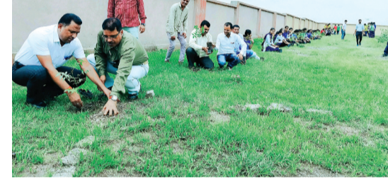
हरिभूमि न्यूज | खुजनेर

तहसीलदार सहित पटवारी एवं स्टॉफ ने रोपे पौधे, दिया पर्यावरण संरक्षण का संदेश