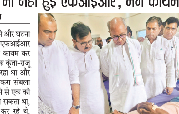
एफआईआर दर्ज नहीं हुई है।